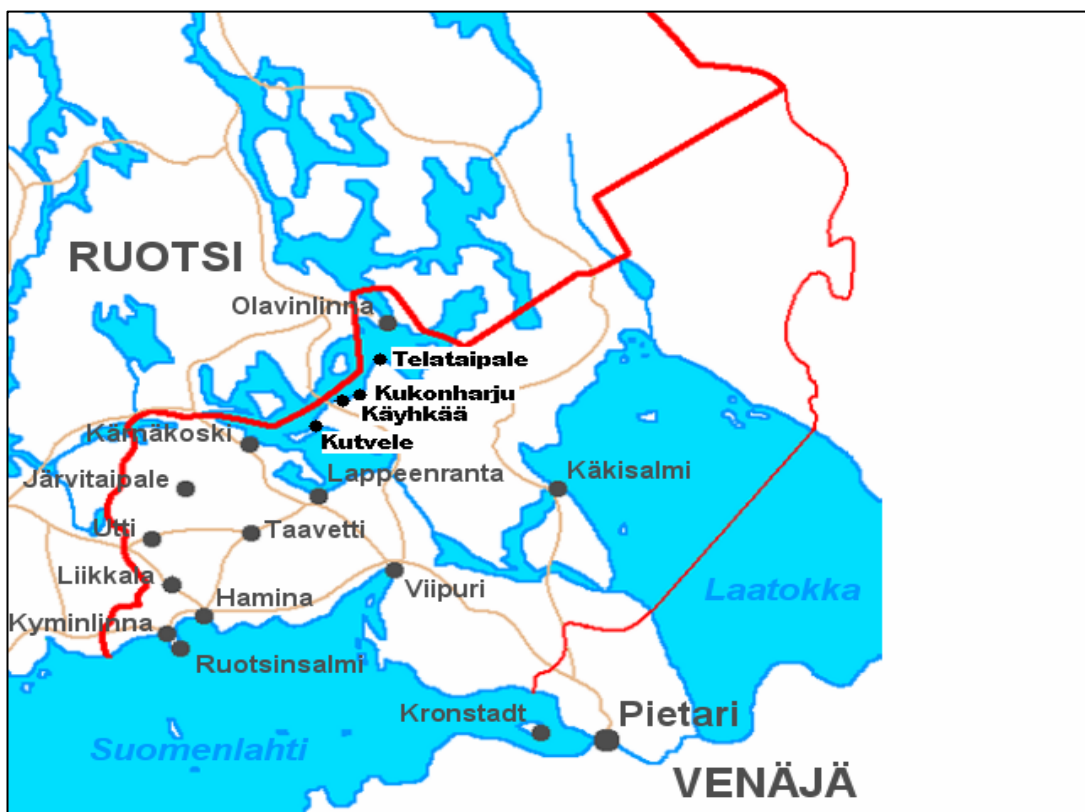
Kuva 2. Kaakkois-Suomen linnoitusjärjestelmä sekä sotakanavat.